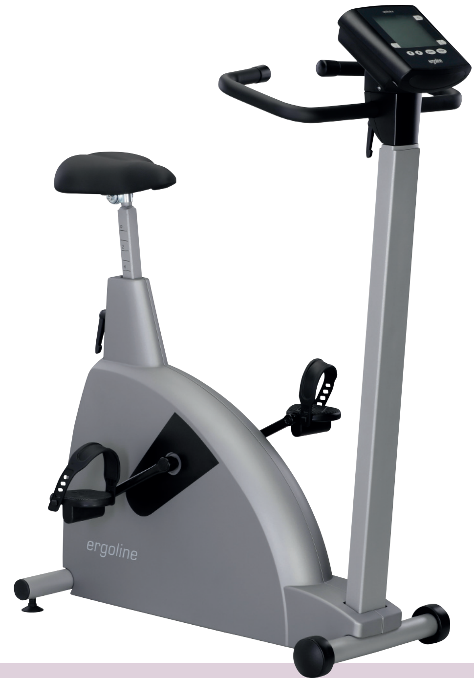
optibike 50 med Trainings-Ergometer